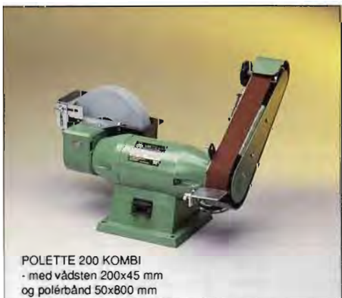
POLETTE 200 KOMBI - med vådsten 200x45 mm og polérbånd 50x800 mm