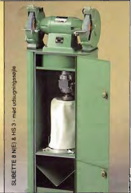
SLIBETTE 8 N(E) & HS 3 - med udsugningssøjle