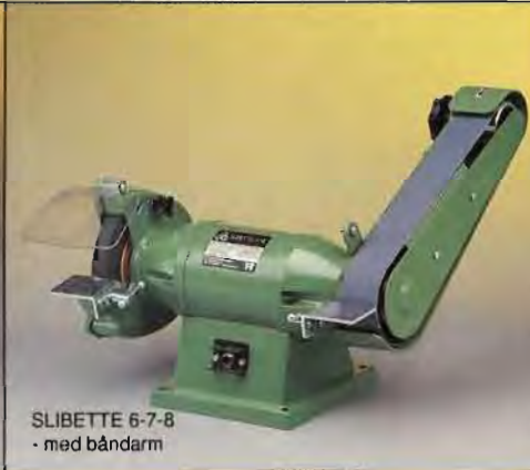
SLIBETTE 6-7-8 - med båndarm