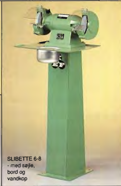
SLIBETTE 6-8 - med søjle, bord og vandkop