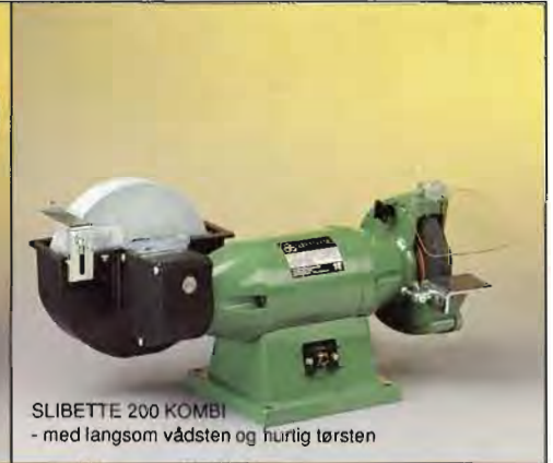
SLIBETTE 200 KOMBI - med langsom vådsten og hurtig tørsten