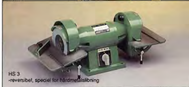
HS 3 -reversibel, special for hårdmetalslibning