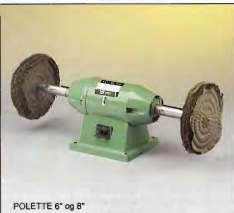
POLETTE 6* og 8*