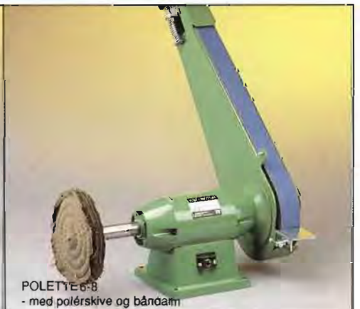
POLETTE 6-8 - med polérskive og båndarm