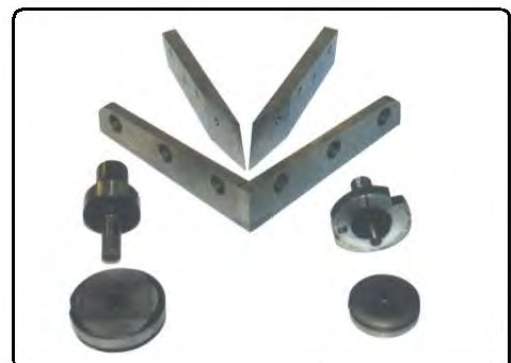
Knive til 90° og til variabel vinkel samt eksempler på stansestempler og matrixer.