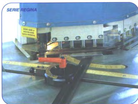
Lineal, vinkelangivelse samt 8 små hydrauliske stempler til fastholdelse af plade på TV256