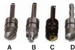
OPTIONAL For ART. 40