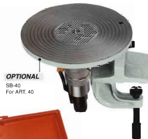
OPTIONAL SB-40 For ART. 40